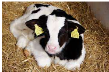
Celmanax Liquid hatása a gyarapodásra

Megjegyzés: 60 napos itatási kísérlet, 8ml Celmanax Liquid/nap